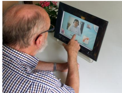
Bild 2 Intuitive Videotelefonie - ein Fingertippen auf das Foto genügt - ein Telefongespräch wird aufgebaut.

Die Unterstützung und Erhaltung der sozialen Eingebundenheit wird durch ein touchscreen-basiertes Terminal mit optisch ansprechendem Holzrahmen und mechanischem Schieber zum Abdecken der Kamera (Bild 2) gefördert.