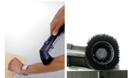
Bild 4 „Trockendusche“ im Einsatz – Wasser wird zur Reinigung aufgebracht und gleich wieder entfernt.

ohne dass dabei Wasser ins Bett oder die Umgebung austritt (Bild 4).